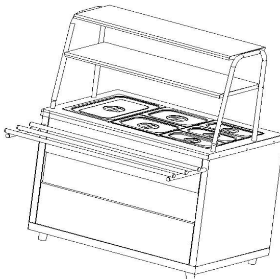
Рис.1 Общий вид мармита МЭП-2Б/ЛП и МЭП-2Б/ЛПЭ

Общий вид мармита представлен на рис. 1. В серии «Лира-Профи» корпус мармита изготовлен из нержавеющей стали, в серии «Лира-Профи Эко» отдельные элементы изготовлены из окрашенной оцинкованной стали. В столешницу мармита встроена прямоугольная ванна с электронагревательными элементами.