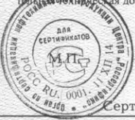
Схема сертификации № 3. Место нанесения знака соответствия при добровольной сертификации - сопроводительная документация и этикетка.